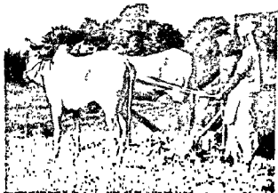
Nehru at the plough (Song 53)